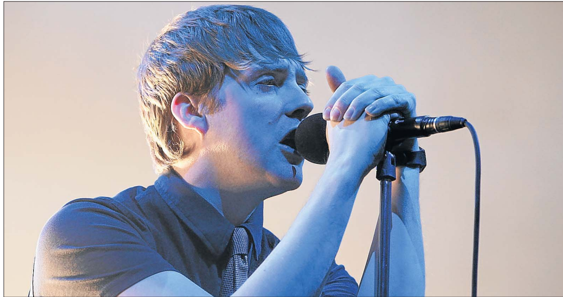
Die britische Band „Kaiser Chiefs“ stellt beim „Terres-Rouges-Festival“ ihr neues Album vor.

Das eigentliche „Streetfestival“ spielt sich von Freitag bis Samstag in den Straßen der ehemaligen Industriestadt ab. Rund 60 nationale und internationale Künstler werden die Stadt rund um die „Rue de l'Alzette“, die „Place du Brill“, die „Place Boltgen“ und die „Place de l'Hôtel de Ville“ erobern, um sie in eine pulsierende