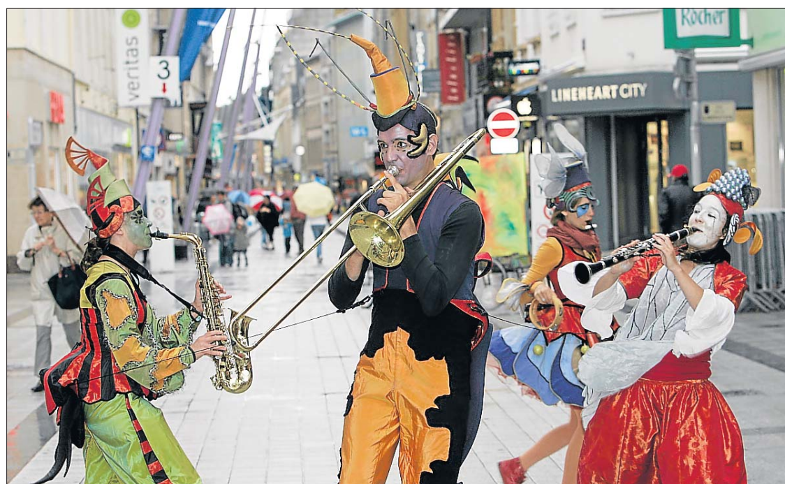
Dix-huit spectacles sur deux jours et des tonnes d'improvisations en pleine rue sont au programme